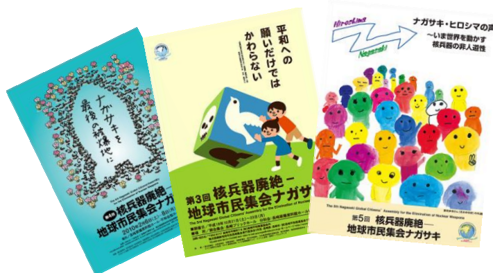
核兵器廃絶地球市民集会ナガサキマーク